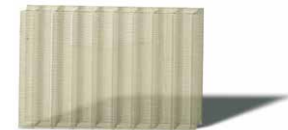
Muestra 2: ΔYi = 2: Garantía de la placa LEXAN THERMOCLEAR