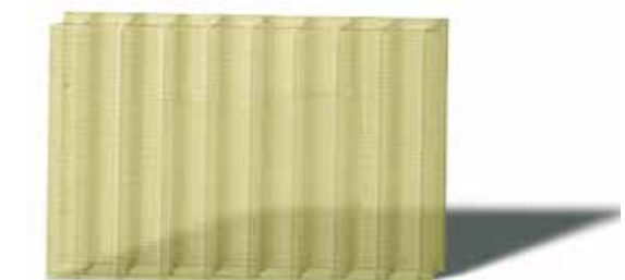
Esempio 3: \Delta Y_i = 10 : Garanzia tipica di lastra in polycarbonato alveolare