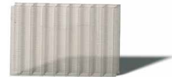
Esempio 1: \Delta Y_i = 0

Per ulteriori informazioni la preghiamo di rivolgersi al suo distributore locale o all'ufficio commerciale della SABIC Specialty Film & Sheet.