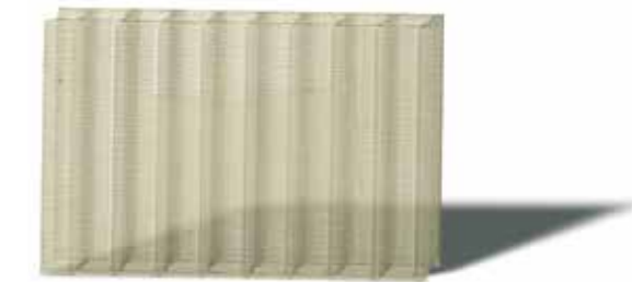
Muster 2: \Delta Y_i = 2 : LEXAN THERMOCLEAR Platten-Garantie