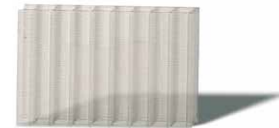
Echantillon 1: ΔYi = 0

Merci de consulter votre distributeur ou SABIC's Innovative Plastics représentant local pour plus d'informations.