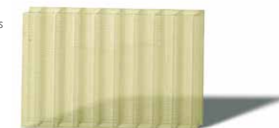
Echantillon 3: ΔYi = 10: garantie typique des autres plaques polycarbonate.