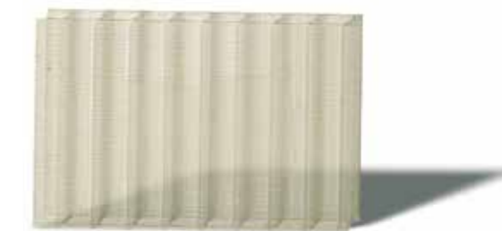
Echantillon 2: ΔYi = 2: garanties LEXAN THERMOCLEAR